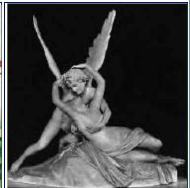
A. Canova, Amore e Psiche (1788-93)

«L'innamoramento introduce in questa opacità una luce accecante. L'innamoramento libera il nostro desiderio e ci mette al centro di ogni cosa. Noi desideriamo, vogliamo assolutamente qualcosa per noi. Tutto ciò che facciamo per la persona amata non è far qualcosa d'altro e per qualcun altro, è farlo per noi, per essere felici. Tutta la nostra vita è rivolta verso una meta il cui premio è la felicità. I nostri desideri e quelli dell'amato si incontrano. L'innamoramento ci trasporta in una sfera di vita superiore dove si ottiene tutto o si perde tutto. La vita quotidiana è caratterizzata dal dover fare sempre qualcosa d'altro, dal dover scegliere fra cose che interessano ad altri, scelta fra un disappunto più grande ed un disappunto più lieve. Nell'innamoramento, la scelta è fra il tutto e il nulla. [...] La polarità della vita quotidiana è fra la tranquillità ed il disappunto; quella