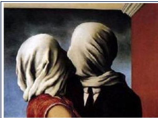
R. Magritte, Gli amanti (1928)